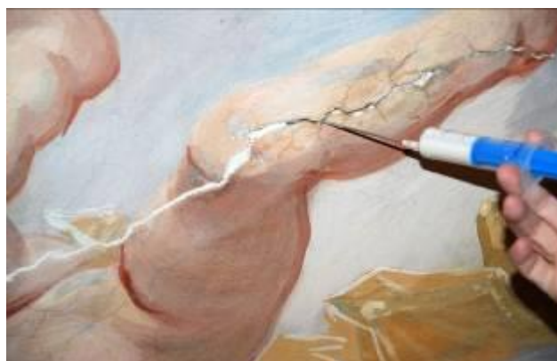
Obr. 2: Restaurování – hloubkové zpevňování středové spáry