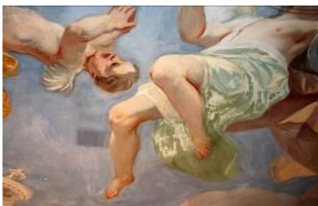
Obr. 5: Restaurování - odstraňování přemaleb