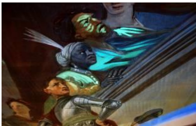
Obr. 3: Průzkum v UV světle - zjištění přemaleb