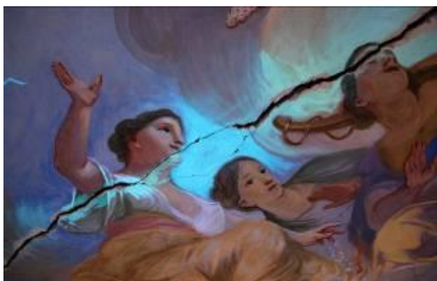
Obr. 1: Průzkum v UV světle v místě středové spáry

Nyní Vám přinášíme unikátní fotografie z průběhu rekonstrukce stropní fresky. Na fotografiích můžete sledovat jednotlivá stádia rekonstrukce, navíc v detailních záběrech, které se běžnému návštěvníku nenaskytnou. Veřejnost může s jistými omezeními vidět stropní malbu již nyní – ze stávající prohlídkové trasy, která vede ostatními prostory knihovny, s tím, že vlastní Filosofický sál stále patří restaurátorům.