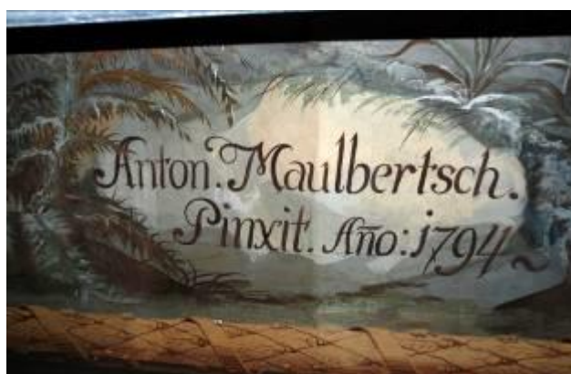
Obr. 6: Vzorek čištění v místě signatury

Pokud budete mít zájem o předlohy fotografií k reprodukci, obraťte se prosím na mne nebo přímo na ing. Feřtkovou ( fertkova.jana@seznam.cz ) –jedná se o velké soubory (5 MB..).